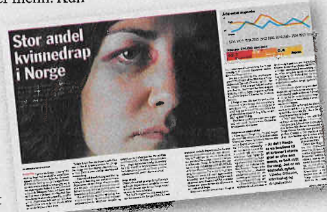
Faksimile fra Ny Tid nr. 8/2009.